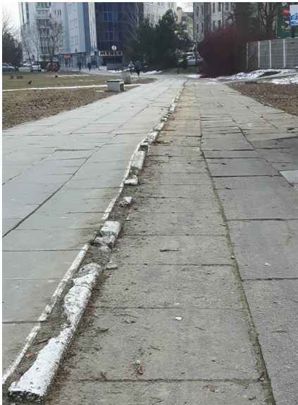
Obecny stan chodnika.

innych miastach Polski oraz dopuszczalnymi normami krajowymi i międzynarodowymi.